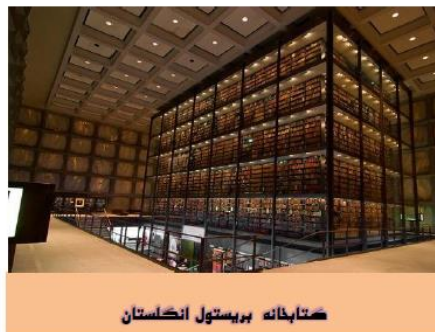
کتابخانه بریتول انگلستان